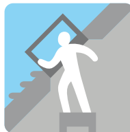
Таблица размеров окна-люка GVT 103