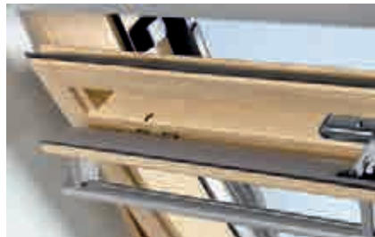
Вентиляционный клапан-форточка модели GXL.