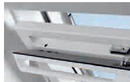
Вентиляционный клапан-форточка модели GPU.

Необходимо утеплить откосы и зазор между оконной коробкой и конструкциями кровли.