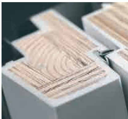
Окно GPU в разрезе

Для обеспечения лучшего обзора рекомендуется установка в комбинации с GIL.