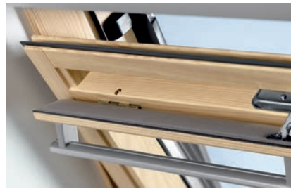
Вентиляционный клапан-форточка модели GPL.

Для обеспечения лучшего обзора рекомендуется установка в комбинации с